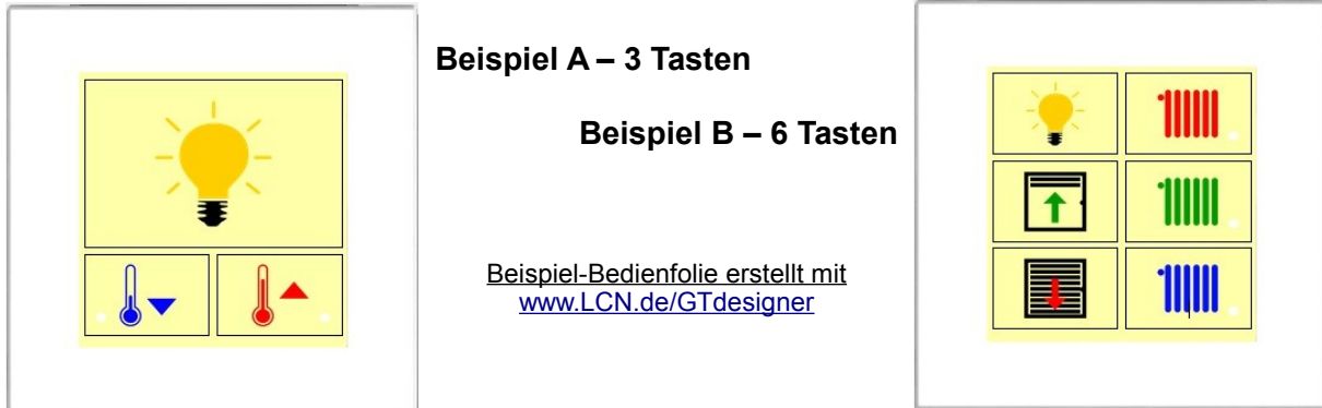
Beispiel A – 3 Tasten

An zwei Beispielen wird gezeigt, wie man die Heizungssteuerung mit diesem Glastaster realisieren kann.